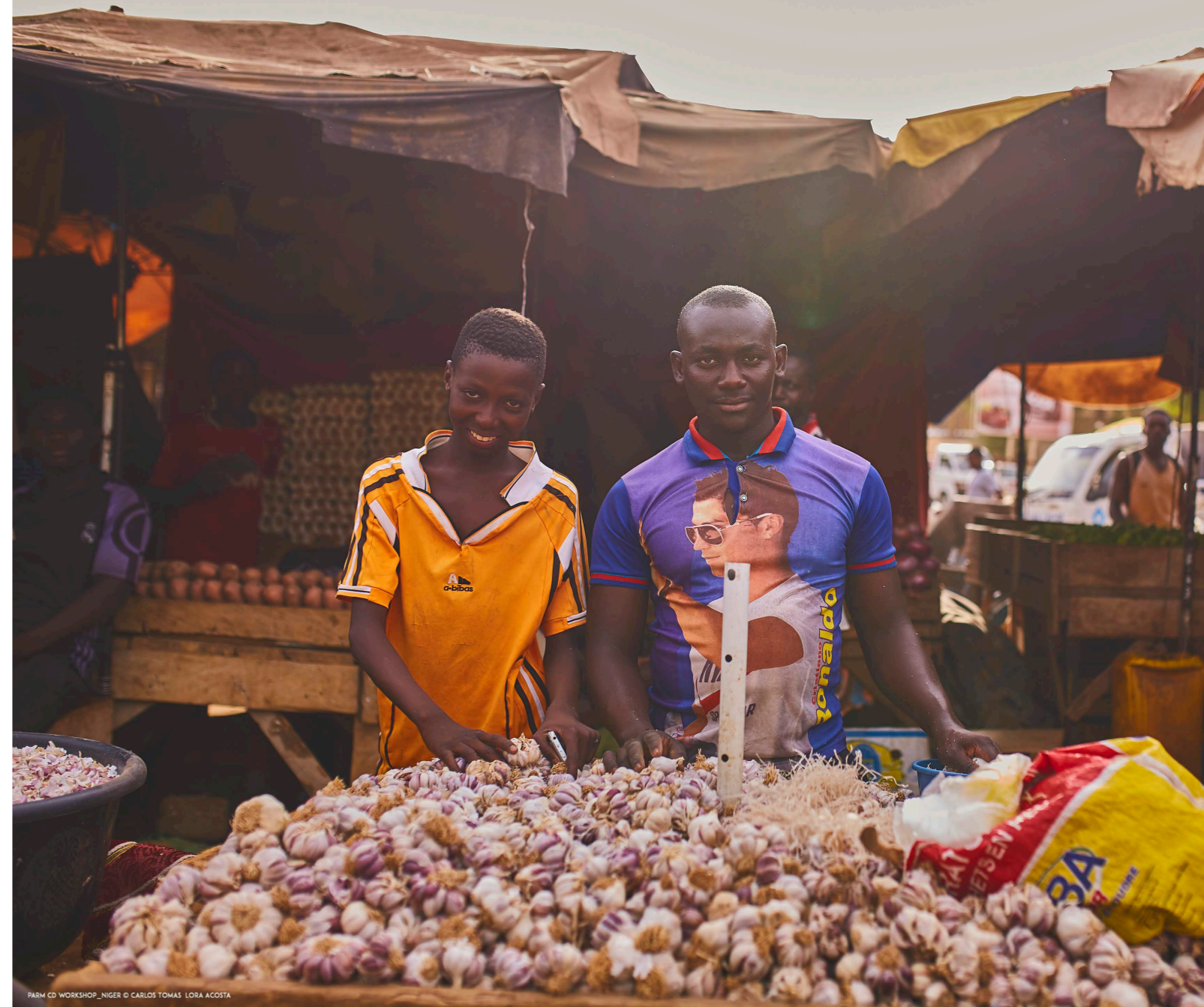
PARM CD WORKSHOP_NIGER